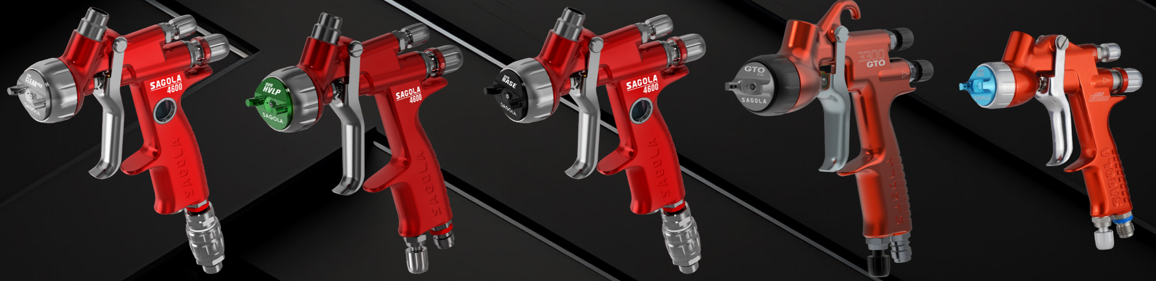
DVR CLEAR PRO SAGOLA 4600