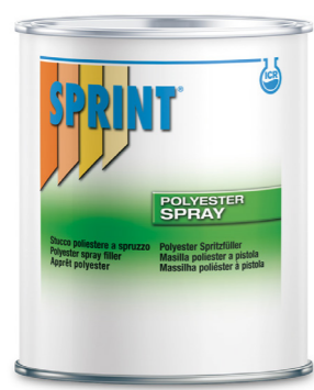
F18 Polyester Spray Filler