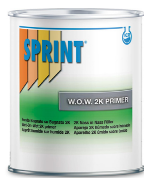
F12 Wet on Wet 2K Primer