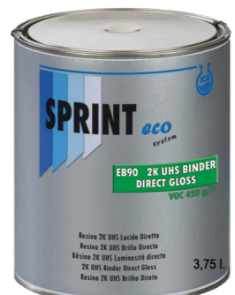
2K UHS Direct Gloss VOC 420