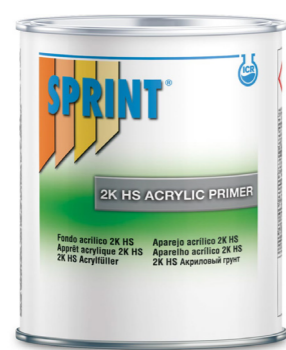
F90/91 • F57/58 • U1/U3 2K HS Primer 5:1