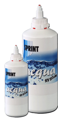
Waterborne Paint System