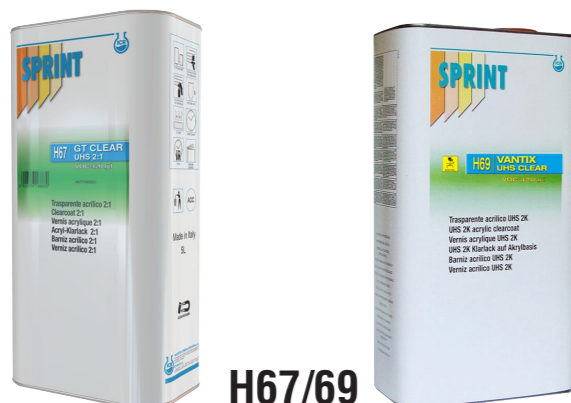
H67/69 UHS Clear 2k 2:1